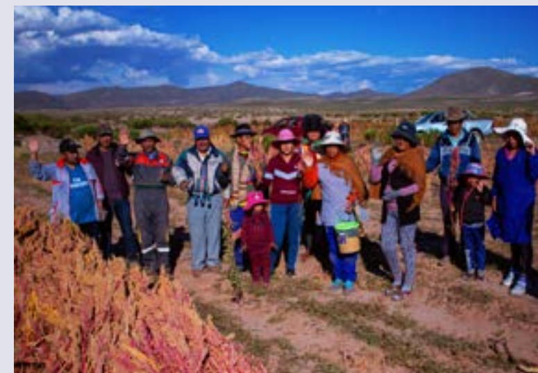
Récolte du quinoa sur l'Altiplano bolivien. 2244 familles d'agriculteurs se sont regroupées au sein d'ANAPQUI pour commercialiser ensemble leurs produits.

Cultivé depuis des millénaires dans les Andes, le quinoa est devenu très populaire dans nos régions. Cet engouement a positionné les agriculteurs boliviens sur un marché international dont la baisse est aujourd'hui problématique. L'Asociación Nacional de Productores de Quinoa (ANAPQUI) aide les familles de paysans à bien commercialiser leurs produits. Pour ce faire, elle a d'urgence besoin d'un camion.