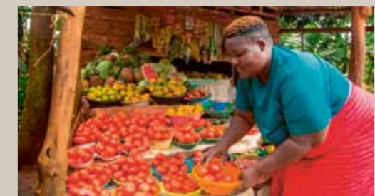
Mit Startkapital und Schulungen zum Marktstand: Frauen in Kamuli erwirtschaften ein eigenes Einkommen.

Viele der rund 700 Dörfer im Kamuli-Distrikt liegen abgelegen und sind nur schwer erreichbar. Damit Schulungen, medizinische Einsätze und Unterrichtsmaterial zuverlässig ankommen, braucht es ein robustes Geländefahrzeug. Es ermöglicht dem Team, regelmässig vor Ort zu arbeiten und die Programme wirkungsvoll umzusetzen.