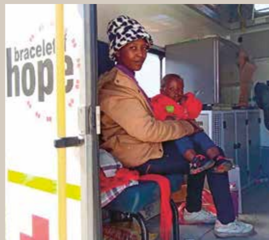
Untersuchungen, Beratung und Medikamente – die mobile Klinik bietet umfassende Versorgung.