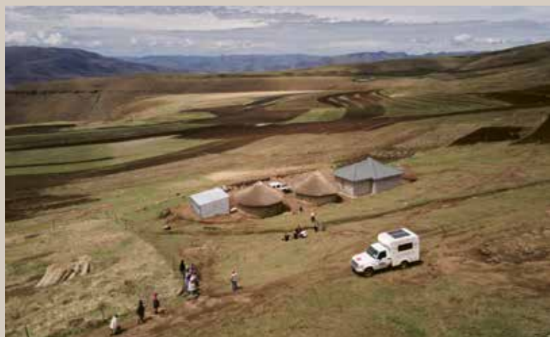
Über Schotterpisten und Hügel: Die mobile Klinik erreicht auch abgelegene Dörfer im Hochland Lesothos.