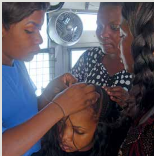
Dans le bus transformé, les jeunes femmes apprennent l'art de la coiffure africaine.

Parmi ses diverses activités, SDMIC gère la «Wings Mobile School». Cette école professionnelle mobile propose des cours d'informatique et de coiffure africaine traditionnelle. Ses principales bénéficiaires sont les filles défavorisées et sans instruction de la région de Dar es Salaam. Les cursus durent six mois et permettent aux jeunes d'acquérir des compétences qui les aident à trouver un emploi ou à créer leur petite entreprise. Elles peuvent ainsi gagner de l'argent et améliorer leurs conditions de vie, ainsi que celles de