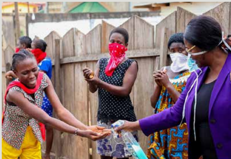
Beaucoup de personnes vivent toujours dans la zone de conflit, sans aucune aide humanitaire ni sanitaire des autorités.

Au Cameroun, près de 900 000 personnes ont dû fuir leur maison. La plupart vivent sans protection dans des camps au milieu des bois, inaccessibles sans un pick-up robuste.