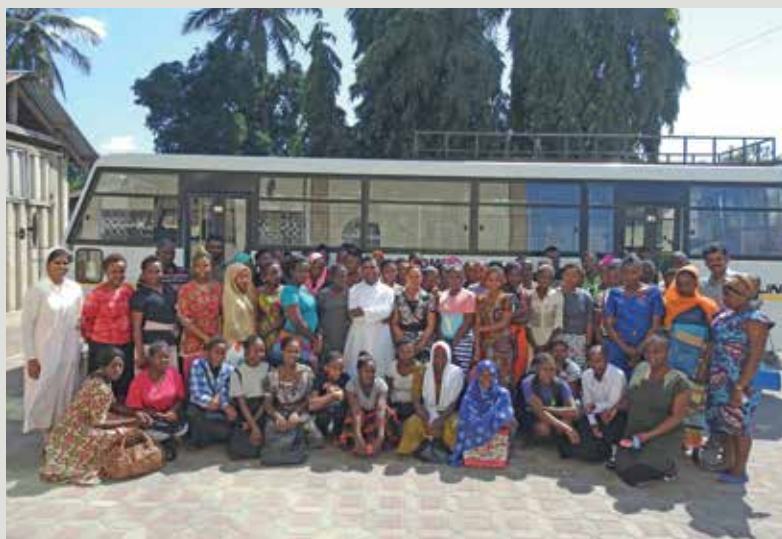
Grâce au bus, des centaines de jeunes de la région de Dar es Salaam ont déjà pu suivre ce programme de formation professionnelle mobile.

Lorsqu'il n'y a pas assez d'argent pour l'école, les garçons ont souvent la préférence et les filles restent à la maison. En Tanzanie, un bus propose des formations sur le terrain et ouvre des perspectives.