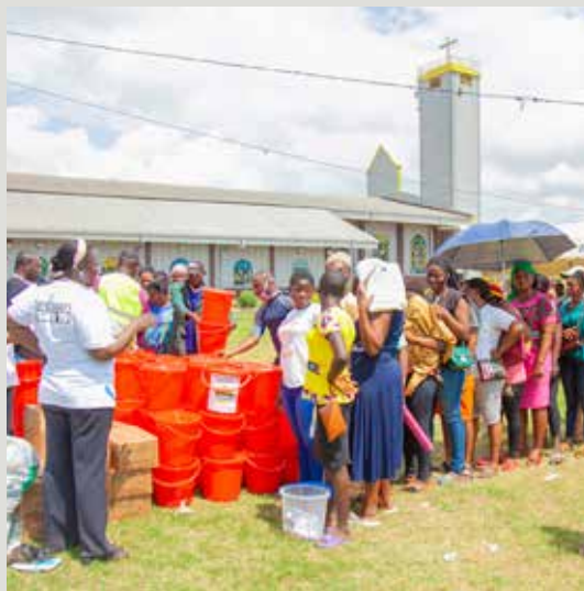
Distribution de produits humanitaires et de matériel de lutte contre le Covid-19 aux réfugiés.

L'ONG a déployé des activités pour améliorer la situation de 10 000 personnes déplacées à l'intérieur du pays et de 20 000 personnes qui vivent toujours dans la zone de conflit.