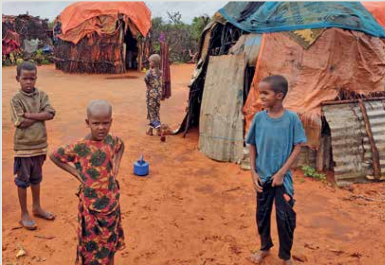
Les familles nomades de Somali vivent dans de simples huttes, dans des conditions d'hygiène précaires.

Malheureusement, les grossesses aux conséquences fatales ne sont pas rares dans les communautés d'éleveurs nomades. Une équipe de santé mobile se déplace en pick-up pour proposer des services médicaux.