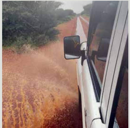
L'équipe doit effectuer un trajet de 9 à 10h pour atteindre la zone d'intervention.

Pour y remédier, l'ONG Women's Hope International a élaboré un projet global de santé maternelle. Celui-ci propose notamment aux futures mères un soutien professionnel pendant la grossesse et l'accouchement. Elle sensibilise également les hommes à l'importance des soins de santé pour les mères et les nouveau-nés. Cela permet de faciliter l'accès des femmes enceintes aux services de santé maternelle et infantile. Par ailleurs, le projet vise à mieux former les professionnels de santé publique et à améliorer les infrastructures existantes.