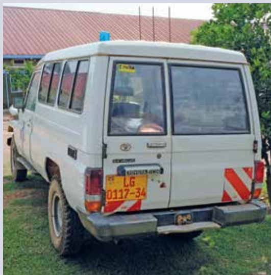
L'ancienne ambulance, pratiquement hors d'usage, doit être remplacée d'urgence.

L'hôpital de Nkozi Our Lady Health of the Sick fournit depuis plus de 75 ans des services de santé fondamentaux aux populations pauvres de la région. Créé par des religieuses néerlandaises, il dépend de l'archevêché de Kampala. Il emploie 119 personnes et a une capacité de 100 lits. L'hôpital soigne couramment des pathologies telles que le paludisme, la diarrhée, la pneumonie, l'hypertension et le diabète. Il prend en charge les victimes d'accidents de la route. Dans le cadre d'un programme de proximité, il organise également des campagnes de prévention du VIH/sida, des distributions de médicaments et des vaccinations dans les villages environnants.