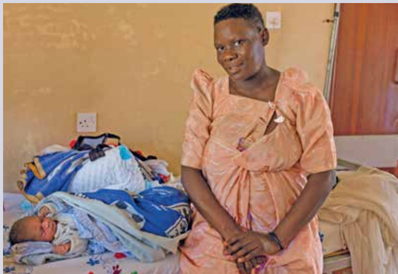
Avec cinq naissances par jour environ, la clinique fonctionne à un rythme soutenu.

En Ouganda, la crise du coronavirus a mis en lumière l'importance de transports fiables, notamment pour les femmes enceintes souffrant de complications. Une ambulance opérationnelle peut sauver des vies.