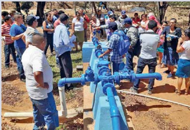
Formation des comités de gestion de l'eau à l'exploitation et à l'entretien de systèmes d'eau modernes.