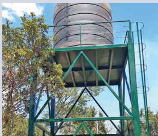
Ce nouveau réservoir d'eau sera remis au comité qui assurera sa gestion.

Le projet prévoit la construction de nouvelles infrastructures et la rénovation de celles qui existent, le recours à des outils de communication modernes et la formation ciblée de 365 comités locaux de gestion de l'eau, ainsi que du personnel technique des communes. Ce travail complexe, dans une région difficile d'accès, exige une grande mobilité. Pour accomplir sa mission importante, l'équipe de SIMAS a d'urgence besoin d'un pick-up robuste.