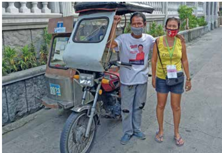
Les tuk-tuks ont des panneaux solaires sur leur toit et fonctionnent sur batterie.

Les typhons, les inondations et les sécheresses à répétition sont les conséquences du changement climatique. Dans les villes des Philippines, il est urgent d'agir pour une mobilité plus durable.