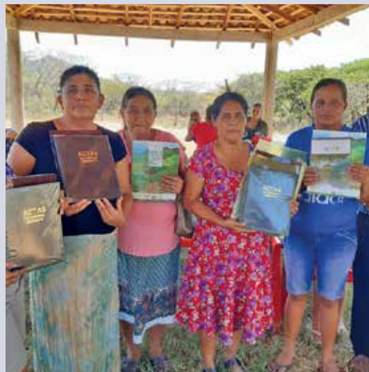
Des stagiaires du projet montrent fièrement leurs certificats.

Dans le nord-ouest du Nicaragua, frappé par la sécheresse, l'eau est une ressource de plus en plus rare. Un pick-up fait avancer la construction de nouveaux systèmes d'eau.