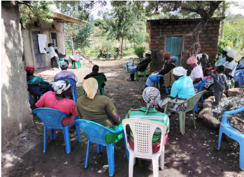
G-BLACK forme des petits agriculteurs dans un village isolé du comté de Machakos