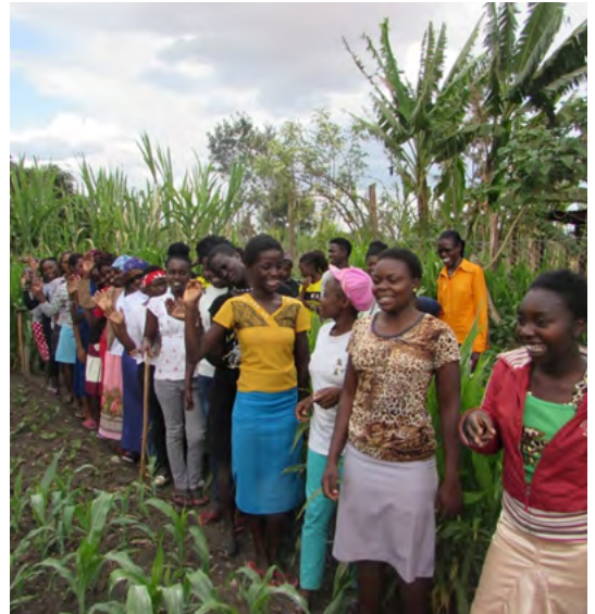
Des jeunes femmes défavorisées suivent une formation à l'agriculture durable

Une agriculture respectueuse des ressources améliore la sécurité alimentaire. Un véhicule tout-terrain permettra d'acheminer le matériel et le savoir-faire vers les fermes isolées.