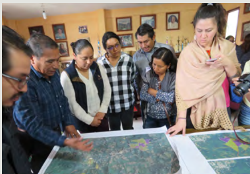
CODIGO-DH soutient les familles autochtones d'Ayutla qui luttent pour faire valoir leur droit à l'eau.

Pour assurer un transport sûr et efficace de l'équipe vers des communautés situées dans un rayon pouvant atteindre 350 kilomètres, l'ONG a besoin de son propre véhicule.