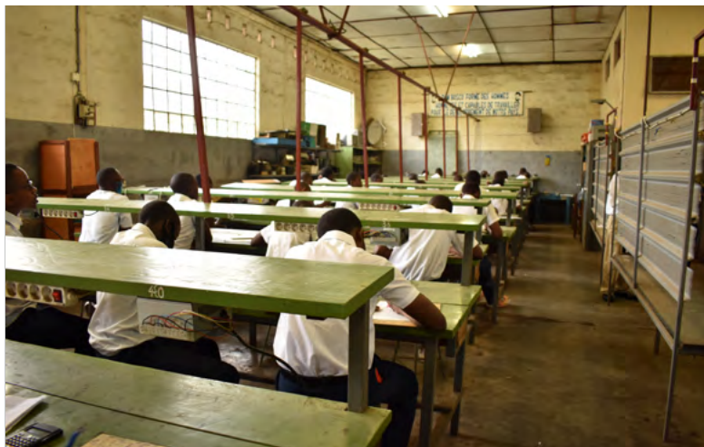
La formation allie la théorie à la pratique, grâce à un équipement technique complet

À l'est de la République démocratique du Congo, la population subit depuis plus de 20 ans les conséquences d'un conflit sanglant entre les rebelles et le gouvernement. La vie est marquée par la violence, la pauvreté et le chômage. En l'absence de réseau national d'écoles, les perspectives sont maigres pour les jeunes.