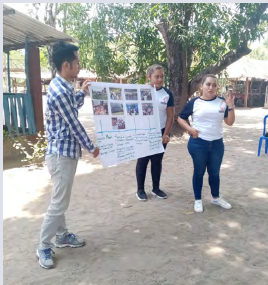
Lors d'ateliers, les jeunes élaborent des idées pour s'organiser et s'engager dans leur communauté.

Avec son projet Jóvenes: +Oportunidades & -Violencias, l'organisation CRIPDES souhaite montrer à ces jeunes qu'ils peuvent emprunter d'autres voies. Elle leur offre ainsi la possibilité de suivre des cours dans une école professionnelle et agricole, d'apprendre à lancer une micro-entreprise ou un projet agricole et d'entrer en contact avec des entreprises locales. Ces actions s'accompagnent d'un travail d'information sur la violence, la sexualité et la santé. L'idée est simple: plus les jeunes ont de chances et de perspectives, moins ils sont susceptibles de rejoindre un gang.