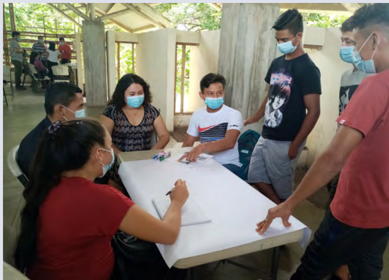
Des jeunes issus de familles pauvres bénéficient d'une bourse afin de dépasser l'école primaire et d'obtenir leur maturité.

Aux yeux des adolescents, rejoindre un gang semble souvent le seul moyen de subvenir à leurs besoins fondamentaux. Un pick-up permettra de proposer des formations dans les régions rurales.