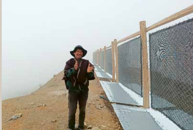
Ici, le brouillard se transforme en eau. Dans les régions arides autour de Villa Serrano, ces installations captent l'humidité présente dans l'air.

Des communautés rurales améliorent la gestion de l'eau et la sécurité alimentaire