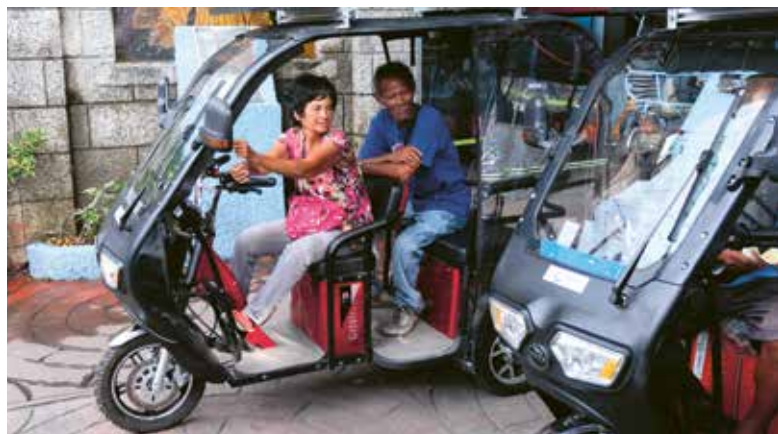
Rouler à l'énergie solaire: les projets miva misent sur de nouvelles formes de mobilité, là où elles sont adaptées.

Des partenaires solides, des technologies éprouvées, une infrastructure performante: lorsque les conditions sont réunies, miva est ouverte à de nouvelles voies. Car l'objectif reste inchangé: permettre aux gens de se déplacer et acheminer l'aide là où elle est nécessaire, que ce soit à la force des bras ou au moyen de moteurs électriques ou thermiques.