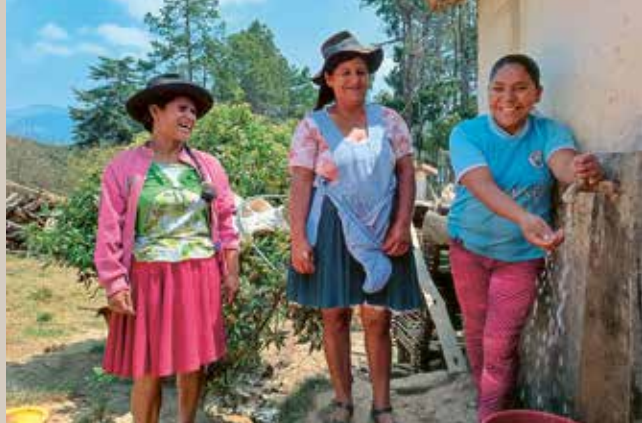
À la fontaine, on voit ce qui a longtemps manqué: de l'eau pour la vie quotidienne.

Grâce à votre soutien, ce lien perdure – et la population peut façonner son propre avenir.