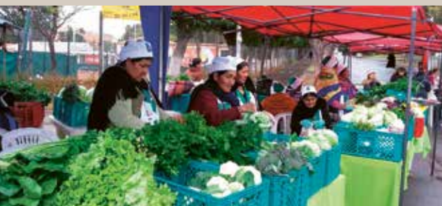
Ce qui dépasse les besoins du foyer est vendu au marché de Sucre et génère un revenu.