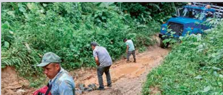
Des hommes réparent la route entre Frontino et La Blanquita Murri, impraticable sans véhicule tout-terrain.

Dans les montagnes isolées de Colombie, les communautés autochtones vivent souvent dans des conditions difficiles. Un véhicule tout-terrain permet de leur apporter de l'aide et des perspectives.