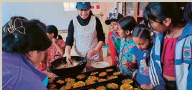
À l'école, les enfants apprennent à préparer des repas sains à partir des récoltes.

Mais toutes ces activités nécessitent plus que des connaissances et de l'engagement. Les différentes communes sont dispersées et difficiles d'accès. Pour mettre en œuvre les initiatives et installer les capteurs de brouillard, il est essentiel d'assurer un transport fiable du matériel, des spécialistes et des récoltes. Le véhicule actuel n'est plus adapté à cet usage. Un nouveau véhicule tout-terrain permettra de continuer à acheminer l'aide vers les populations et de poursuivre les actions déjà engagées. Car là où l'eau redevient accessible, ce ne sont pas seulement des jardins qui naissent, mais aussi de nouvelles perspectives.