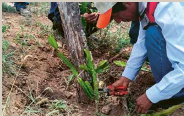
Dans les champs, de nouvelles cultures mieux adaptées à la sécheresse sont mises en terre.