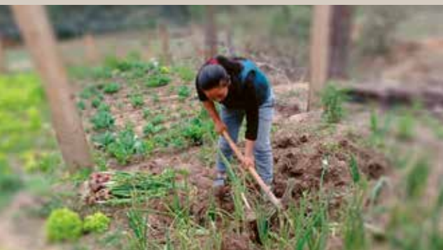
On s'active à nouveau dans les jardins. Les cultures assurent l'alimentation des familles.