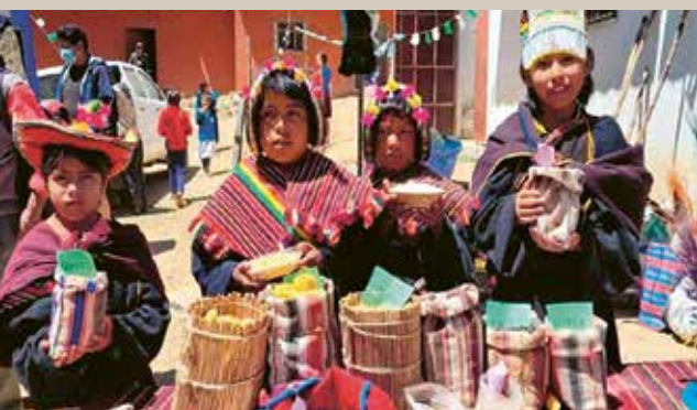
Les enfants présentent leurs produits et participent à la vie du marché.

Quand la pluie se fait attendre, les conséquences dépassent largement la prochaine récolte. Dans les communes situées autour de Villa Serrano, en Bolivie, le changement climatique oblige les familles à réinventer leur quotidien. De minuscules gouttes d'eau peuvent alors ouvrir de nouvelles perspectives.