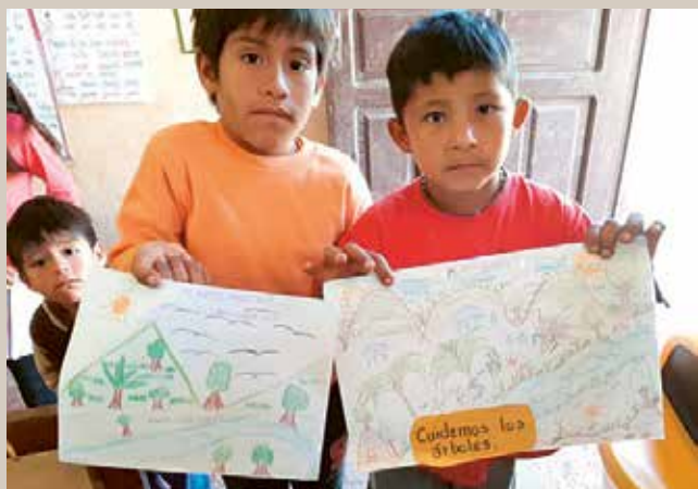
Les enfants apprennent à protéger leur environnement et à s'adapter aux nouvelles conditions.

sances sont directement mises en pratique dans les champs et souvent transmises au sein de la communauté.