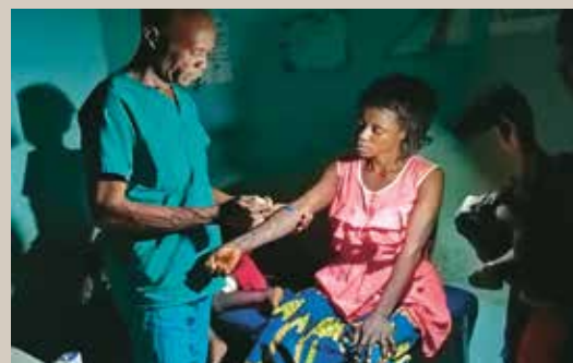
Centre de santé d'Ifwanzondo: en cas de coupure de courant, l'éclairage reste assuré par une lampe de poche.

Les soins médicaux gagneront ainsi en fiabilité. L'aide touchera davantage de personnes, y compris dans les villages difficiles d'accès.