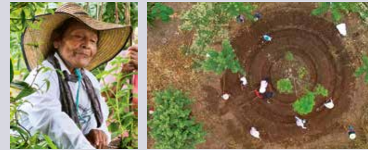
Des jardins circulaires allient semences traditionnelles et nouvelles méthodes pour assurer la souveraineté alimentaire.

La Colombie est riche en biodiversité. Pourtant, beaucoup de communautés rurales souffrent de la faim. Un véhicule neuf leur apportera des semences, des connaissances agroécologiques et un nouveau souffle.