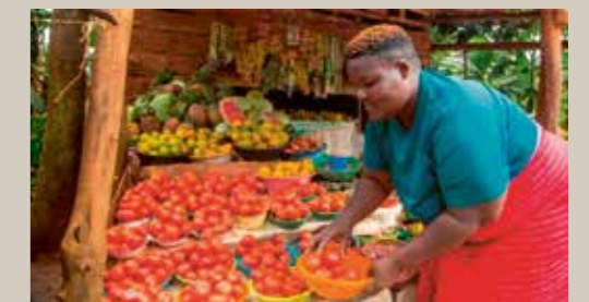
Avec un capital de départ et des formations, les femmes de Kamuli génèrent leurs propres revenus.

Parmi les quelque 700 villages du district de Kamuli, beaucoup sont isolés et difficiles d'accès. Pour que les formations, les interventions médicales et le matériel pédagogique arrivent à bon port, il faut un véhicule tout-terrain robuste. Il permettra à l'équipe de se rendre régulièrement sur place et de mettre en œuvre les programmes avec efficacité.