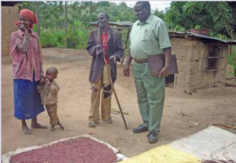
En possédant son propre véhicule, l'ONG aidera les groupes d'agriculteurs à mieux vendre leurs produits sur les marchés.

Dans les régions très reculées du Kenya, seul un véhicule tout-terrain permet de franchir les pistes vallonnées et d'accéder aux familles dans le besoin.