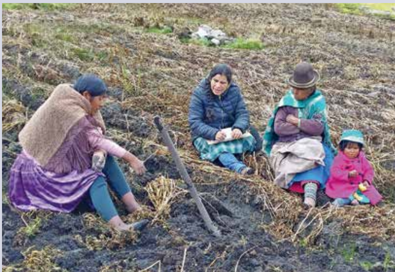
Pour conseiller les agricultrices autochtones, mieux vaut se rendre sur le terrain.

Pour garantir la sécurité alimentaire dans les Andes boliviennes, il faut promouvoir la culture de variétés indigènes de pommes de terre ou de maïs. Ce travail nécessite un pick-up robuste.