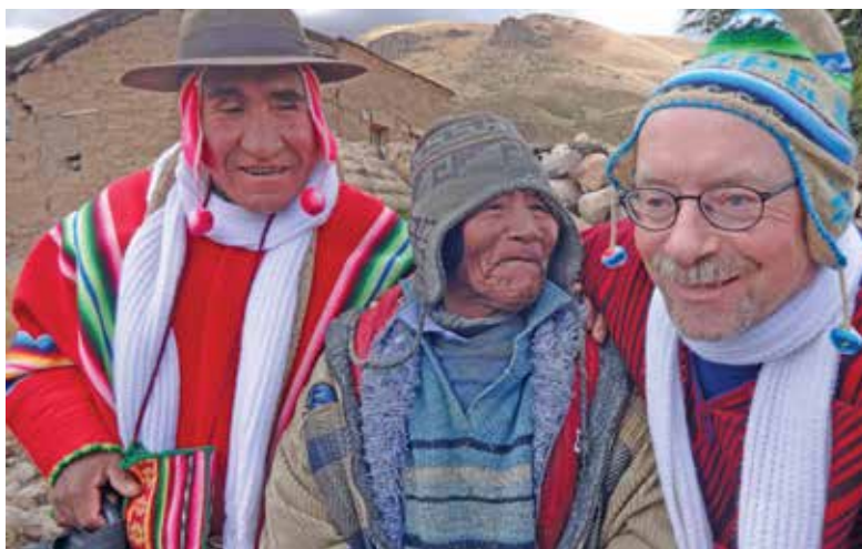
Voyage de projet 2016: rencontre avec les anciens d'une communauté Ayamara sur les hauts plateaux de Bolivie, près d'Oruro