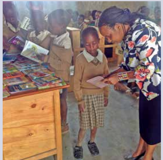
Les enfants particulièrement défavorisés pourront accéder à l'école.

COTRR accompagne sa population cible afin de développer le potentiel inexploité, les ressources et les connaissances. Un élevage de moutons, par exemple, facilite la vie des communautés massaïs en leur fournissant du lait et de la viande à vendre. Des citernes d'eau de pluie aident à surmonter les sécheresses. L'ONG organise également des campagnes de sensibilisation pour discuter de divers sujets et chercher des solutions aux problèmes.