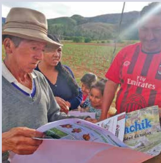
Une revue spécialisée, lue par 15 000 personnes, soutient le travail de sensibilisation.

Le personnel de l'organisation doit souvent être présent sur place. Ses agents se rendent deux à trois fois par mois dans leur zone d'intervention pour dispenser des formations pendant plusieurs jours. Les voies d'accès pentues ne sont pas goudronnées. Elles sont détrempées pendant la saison des pluies et difficilement praticables en juin et juillet à cause de la neige. Les anciens véhicules de CENDA sont pratiquement hors d'usage. Un nouveau pick-up devrait résoudre le problème aigu du transport.