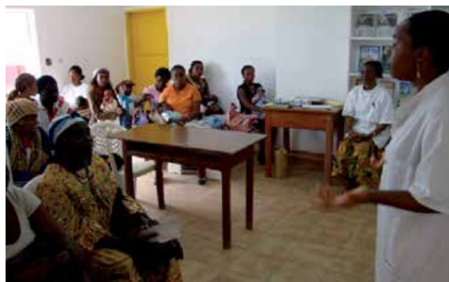
L'hôpital Saint-Luc apporte aux femmes des conseils complets en matière de santé.

Une lutte efficace contre le cancer du col de l'utérus exige une étroite collaboration entre les partenaires. Le minibus-ambulance actuellement disponible ne permet pas de se rendre dans tous les centres, surtout à la saison des pluies. Il devient donc indispensable d'acquérir un véhicule tout-terrain robuste pour transporter en toute sécurité le médecin et les infirmières, avec leur matériel et les médicaments, jusqu'à leurs lieux d'intervention.