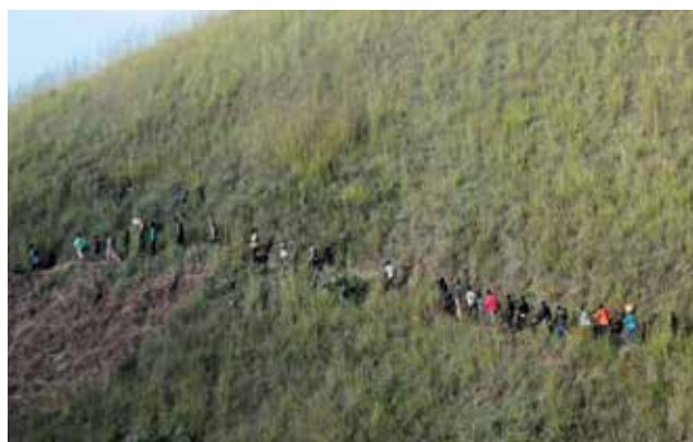
Les enfants soldats libérés cheminent sur détroits sentiers pour rejoindre le véhicule d'Agape Hauts-Plateaux.

Vous trouvez d'autres projets sur www.miva.ch