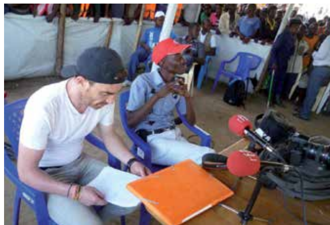
La radio RFI parle souvent du camp et les réfugiés peuvent s'exprimer au micro.

Torture, assassinats, extorsions: face à ces violations des droits de l'homme, beaucoup de personnes quittent le Burundi pour se réfugier à l'est de la RD Congo. Alors que le Congo oriental est lui-même confronté à une multitude de problèmes, de nombreux jeunes de la région s'engagent bénévolement pour les réfugiés et propagent la joie de vivre. Le Club Radio France Internationale (Club RFI) de Bukavu s'implique fortement dans le camp de Lusenda. 26 000 réfugiés vivent sur le site et leur nombre ne cesse d'augmenter. La cohabitation entre les deux groupes ethniques des Tutsis et des Hutus crée souvent des tensions.