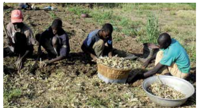
Jeunes hommes en train de récolter des oignons, dont le commerce est encouragé dans cette région aride.

Pour assurer l'organisation et le suivi complet des comités villageois, l'association Toumon Bori a besoin d'être mobile. Les villages reculés sont accessibles par des pistes sablonneuses et rocheuses. Un véhicule tout-terrain robuste supprimera les frais de location et permettra à l'association de mener ses activités de manière bien plus économique et efficace.