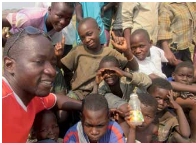
Bénévole encadrant des enfants réfugiés à Lusenda.

Le Club RFI gère une bibliothèque et un centre informatique en collaboration avec le HCR. L'organisation d'utilité publique aborde également des sujets tels que le sida et les droits de l'homme. Une radio pour la paix est actuellement mise en place au sein du camp.