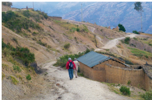
Les membres de l'équipe doivent souvent marcher des heures pour atteindre les personnes vivant dans cette région impraticable.

vention de ces agressions et le soutien aux victimes. Avec son programme «Aprendiendo de las Diferencias» (Apprendre des différences), l'organisation poursuit également un objectif important: favoriser l'insertion dans la société de personnes handicapées – essentiellement des enfants et des jeunes – à travers une stratégie de réadaptation communautaire. L'acceptation de leur «particularité» par la société aide les personnes concernées et leur entourage à s'intégrer et leur ouvre des perspectives. Les principaux bénéficiaires de ce travail sont 12'500 autochtones Quechua vivant dans un dénuement extrême à Morachata, localité située à 3'000 mètres d'altitude.