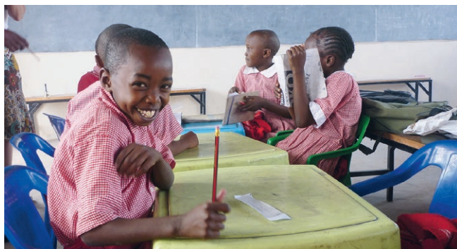
Ces orphelins bénéficient d'une éducation globale.

Le Burundi compte parmi les pays les plus pauvres du monde. Les conflits ethniques qui l'ont secoué pendant de longues années ont déchiré de nombreuses familles et laissé des enfants livrés à eux-mêmes. Beaucoup de ces orphelins vivent dans la rue, où ils mendient ou se prostituent. L'Orphelinat Sainte Francisca Xaveri Cabrini , rattaché à l'archidiocèse de Gitega, accueille des orphelins et d'autres enfants vulnérables pour les doter d'une formation complète. Créé en 1994, l'établissement offre une protection à 51 enfants. Grâce au travail engagé de sa fondatrice et de son équipe, il leur fournit non seulement un toit et de la nourriture, mais leur permet égale-