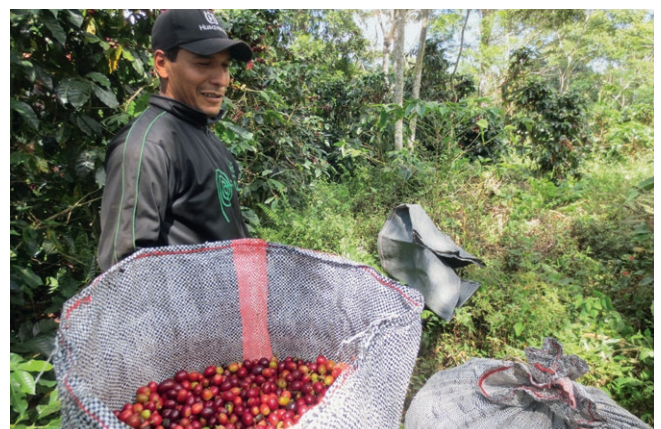
Récolte du café dans la région de Coopchebi, dans la Selva Alta.

Coopchebi, Cooperativa Agraria de Servicios Café Hemalu de los Bosques del Inka réunit 186 membres, 8 collaborateurs administratifs et 10 à 40 employés chargés de l'entretien et de la récolte, selon les besoins. Cette coopérative de café située à San Luis de Shuaro s'engage pour la préservation des ressources naturelles et pour un développement axé sur la justice sociale dans un climat d'échange avec les autres coopératives et les communautés. Elle fait partie d'un réseau de quatre coopératives regroupant 400 membres. 500 familles supplémentaires viennent renforcer la main-d'œuvre pendant les mois de récolte. Coopchebi permet aux cultivateurs d'accéder au marché spécialisé des cafés fins (bio, commerce équitable). Mais pour cela, il faut que toute la récolte de café parvienne sans transformation dans les installations de Coopchebi, pour y être traitée conformément aux exigences de qualité. Le camion tout-terrain miva est trop gros et trop lourd pour les voies étroites et escarpées qui mènent aux fincas et aux communautés. Il doit être complété d'urgence par un pick-up robuste qui permettrait de récupérer les récoltes des petits producteurs et de transporter des personnes.