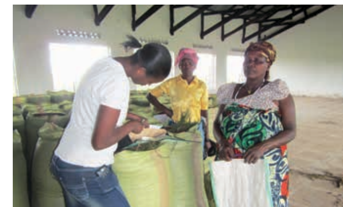
Les Paysannes fournissent leurs récoltes pour le transport commun.

La population de la région de Kagera, est très pauvre. Les infrastructures de santé et d'éducation présentent d'importantes carences, les maladies liées à la pauvreté et la malnutrition sont courantes. Beaucoup d'enfants n'obtiennent pas de diplôme de fin d'études. Mavuno est une ONG régionale qui s'engage pour une lutte globale et solidaire contre la pauvreté dans la région. Les programmes de Mavuno sont variés: projets d'éducation, programmes de nutrition et de santé, amélioration de l'agriculture etc. Les membres de Mavuno, principalement des femmes, sont regroupés en petites coopératives et se soutiennent mutuellement. Le maïs, l'arachide et les haricots s'écoulent à bon