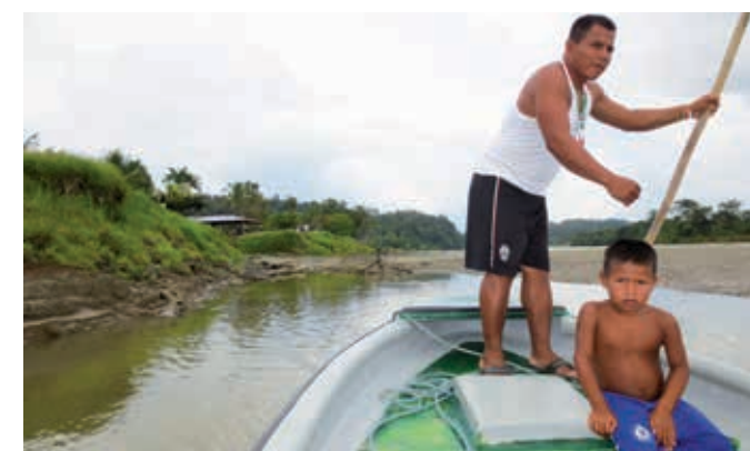
Traversée difficile du fleuve pour se rendre à l'école.

Belén de Iguana abrite 540 membres de l'ethnie Eperara Siapidara. Les familles vivent grâce à la pêche, la chasse, la cueillette et une agriculture simple. L'histoire de la réserve est marquée par la guerre, la faim, les agressions et l'exode collectif. L'isolement et l'absence d'autorité de l'État font de l'espace de vie des Eperara Siapidara un lieu attrayant pour la culture de la coca, le trafic d'armes et de drogue et l'extraction illicite de mercure. Heureusement, la sécurité de la réserve a été préservée. Belén se trouve à seulement cinq heures de bateau du port de Buenaventura, sur l'océan Pacifique. La réserve possède une école secondaire agricole, l'Institución Educativa Técnica Agropecuaria , qui jouit d'une bonne réputation. Belén de Iguana se trouve sur la rive gauche du Río Micay. Pour se rendre à l'école, de nombreux élèves vivant de l'autre côté du fleuve ou au bord de l'un de ses bras doivent utiliser seuls un canoë ou une pirogue. À la saison des pluies, le fleuve déborde régulièrement et se transforme en cours d'eau impétueux: le chemin de l'école n'est alors praticable qu'au péril de leur vie, voire infranchissable. Avec son propre bateau à moteur, l'école peut aller chercher les élèves et ainsi éviter qu'ils ne manquent les cours ou soient victimes d'un accident en route.