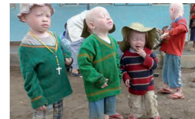
Enfants albinos sur le chemin de l'école enfantine.

La persécution des enfants atteints d'albinisme est très répandue en Afrique centrale, particulièrement en Tanzanie où vivent la plupart des albinos. La population les considère comme des fantômes qui n'ont pas de vie terrestre et devraient être éliminés. Il existe aussi une idée fautive selon laquelle les parties du corps portent bonheur et richesse, idée particulièrement répandue dans les zones rurales du nord de la Tanzanie. Entre 2000 et 2013, plus de 74 albinos ont été tués en Tanzanie. Les parties du corps font l'objet d'un commerce illégal. Depuis quelques années, le gouvernement enregistre toutes les personnes concernées pour leur protection, mais elles n'ont pas toutes répon-