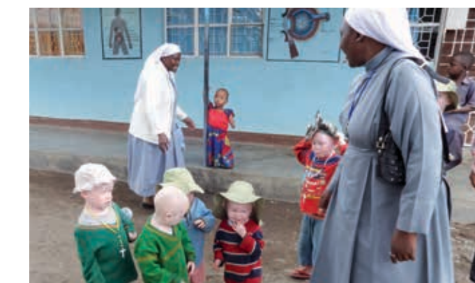
Les sœurs prennent soin avec amour des enfants albinos vulnérables.

du à cet appel. La congrégation diocésaine Our Lady of Kilimanjaro a été fondée en 1931 et opère dans les domaines de l'éducation et de la santé. Les sœurs s'engagent en faveur d'un développement global pour permettre aux gens de mener une vie autonome et épanouie. Leur engagement est axé sur la formation et la prise en charge des filles, des jeunes femmes, mais aussi des enfants handicapés ou albinos. Les enfants aidés sont suivis globalement tout au long de leur parcours scolaire afin qu'ils terminent leurs études et puissent s'intégrer dans la société. Jusqu'à présent, les sœurs ont mené leurs projets en utilisant les transports en commun ou des voitures de location. Dans