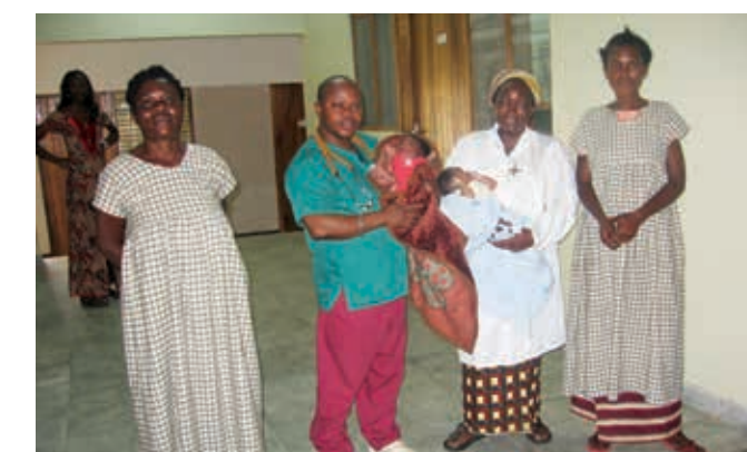
Personnel du centre René de Haes avec un bébé né dans l'hôpital.

Kimwenza se trouve à la périphérie de Kinshasa. Ses habitants sont pauvres et vivent en marge de la société. La nourriture étant rare, beaucoup d'enfants et de femmes souffrent de malnutrition. De plus, l'extrême pauvreté entraîne de nombreux problèmes sociaux tels que la criminalité. Les soins médicaux et les conditions d'hygiène sont médiocres. Des maladies comme le VIH/sida, la tuberculose et le paludisme sont répandues. Le centre de santé René de Haes, géré par la congrégation des Sœurs de Notre-Dame de Namur , s'occupe d'environ 8'000 personnes, dont un grand nombre d'enfants et de femmes en âge de procréer. Il est difficile de se rendre à la capitale car les routes sont mauvaises et Kimwenza n'est pas desservie par les transports publics. Ainsi, l'accès aux infrastructures de santé de Kinshasa est très malaisé et le centre René de Haes joue un rôle très important. Malheureusement, l'établissement ne possède aucune ambulance, ce qui a des conséquences dramatiques pour les parturientes. Un véhicule permettrait d'éviter de nombreuses complications, mais aussi des décès. C'est pourquoi le centre René de Haes demande à miva de l'aider à acquérir une ambulance.