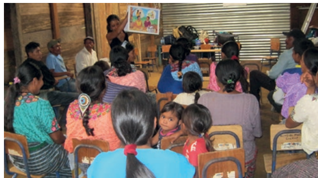
Une infirmière sensibilise les habitants d'un village aux mesures de santé préventive.

Les 7 membres de l'équipe d'APROSUVI effectuent souvent plusieurs heures de trajet à pied, ce qui réduit leur temps de travail effectif et le nombre de patients qu'ils peuvent prendre en charge. L'équipe a d'urgence besoin d'un véhicule tout-terrain robuste pour acheminer le personnel et le matériel sur les lieux d'intervention de la manière la plus sûre et la plus rapide possible.