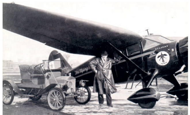
Paul Schulte, le «prêtre volant», avec son avion.

Son amour de l'Afrique a conduit Paul Schulte en Afrique du Sud au cours des dernières années de sa vie. Il s'est éteint le 7 janvier 1974.