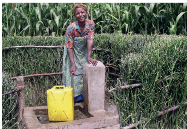
Un point d'eau facile d'accès, c'est une eau potable propre avec moins d'efforts physiques pour les enfants et les jeunes femmes.

Ce programme en faveur de l'eau et de l'hygiène vise à réduire la pauvreté. Il aide les communes et les familles rurales à construire des systèmes de captage des eaux de pluie et de source. Ses formations portent également sur la protection des zones de sources, autre enjeu important. En outre, la population est sensibilisée aux questions d'hygiène et de prévention sanitaire. Ce projet de grande portée bénéficie à plus de 54 000 personnes vivant dans des zones isolées, en particulier les femmes et les enfants (surtout les filles), qui passent beaucoup de moins de temps à aller chercher de l'eau. Les femmes sont plus disponibles pour s'occuper des enfants et du jardin et gagner un revenu annexe. Les enfants peuvent se rendre régulièrement à l'école.