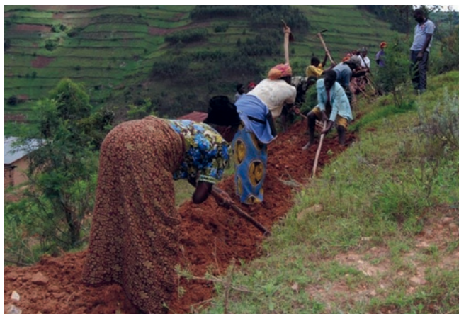
Communauté villageoise en train de créer une canalisation pour stocker les eaux pluviales.

Notre partenaire, le Kigezi Diocese Water & Sanitation Programme (KDWSP), est une organisation de l'Église d'Ouganda. Présent depuis 29 ans dans le sud-ouest du pays, il œuvre pour un approvisionnement en eau et des installations sanitaires durables et de meilleure qualité.