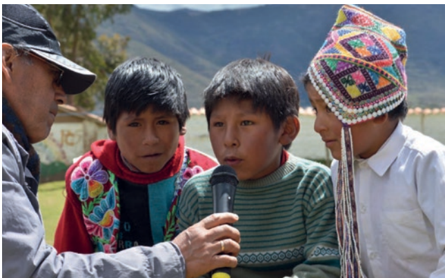
Enfants Quechua évoquant leur culture au micro d'un ingénieur du son.

L'Asociación Pukllasunchis produit depuis 2003 des programmes radiophoniques interculturels en quechua et en espagnol avec des enfants et des jeunes. La radio reste, dans beaucoup de régions du Sud, le média qui permet d'atteindre le grand public. Grâce à ce projet, les enfants de paysans vivant dans les communautés Quechua isolées des Andes et leurs parents deviennent des représentants actifs de leur société. Ils partagent ainsi leurs connaissances et leur conception du monde, ce qui renforce leur identité personnelle et culturelle. Pour transformer les enregistrements réalisés en émissions professionnelles conformes aux exigences des stations de