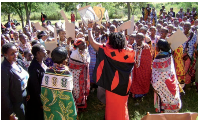
L'ONG dans sa lutte contre l'excision et pour l'éducation des filles au sud-ouest du Kenya.

Enthashata Village est une organisation communautaire locale qui lutte contre l'excision et pour le droit à l'éducation des jeunes filles. Son objectif est que les familles cessent d'exciser leurs filles et remplacent cette pratique par un rite initiatique