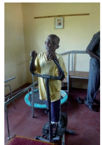
Les enfants handicapés effectuant vos exercices quotidiens.

du SODP à l'occasion d'un voyage de projet. Le respect et la tendresse avec lesquels le SODP s'occupe des enfants handicapés ainsi que l'atmosphère paisible et studieuse qui règne dans l'école et le centre de réhabilitation ont convaincu miva de l'importance d'aider cette organisation – et les enfants handicapés du district de West Kisumu – avec un minibus.