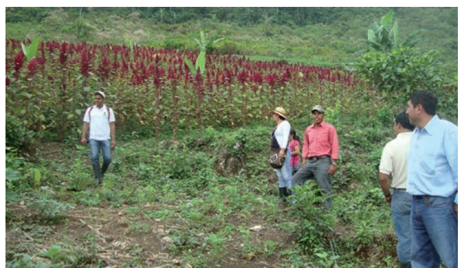
Familles pratiquant la gestion durable des terres.

La construction et la gestion durable d'une infrastructure d'eau potable amélioreront également les conditions de vie locales. La population cible appartient aux groupes ethniques. Ces familles n'ont généralement pas de propriété foncière garantie. Le travail de l'ONG bénéficie directement à 2 600 autochtones dans 16 villages, et indirectement à presque 3 600 d'entre eux. Ils ont d'urgence besoin d'un camion pour accéder aux marchés urbains. Ainsi, ils pourront vendre eux-mêmes leurs excédents de production et cesser de dépendre des «coyotes» (les intermédiaires). miva apporte sa contribution à ce projet.