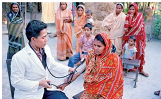
Un médecin effectue des bilans de santé dans les villages grâce à la clinique mobile.

À Barisal, un district du sud du pays, les mariages d'enfants, les grossesses non désirées et les maladies sexuellement transmissibles sont des phénomènes très courants. La plupart du temps, l'aide médicale est sollicitée trop tard ou les soins nécessaires ne sont pas disponibles. Les problèmes de transport empêchent aussi souvent de traiter les personnes en temps voulu. Dans les zones rurales, l'équipement et le personnel des centres de santé sont insuffisants. La petite clinique « Under Five Maternity Clinic » est l'un des premiers et des plus anciens projets soutenus par Caritas Suisse en collaboration avec Caritas Bangladesh. Cette clinique est spécialisée dans la prise en charge des femmes enceintes et des jeunes mères avec leurs enfants en bas âge (jusqu'à 5 ans). La petite clinique a besoin d'une ambulance pour permettre aux femmes enceintes et aux parturientes souffrant de complications, ainsi qu'aux autres patientes et patients, d'arriver à temps à la clinique ou au grand hôpital le plus proche et d'y recevoir des soins à un prix très raisonnable.