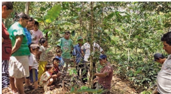
Productrices et producteurs locaux suivant une formation donnée par un technicien de Cáritas Jaén.

Cáritas Jaén s'engage dans le domaine de l'agroforesterie afin d'améliorer les conditions de vie des habitants. Ses activités