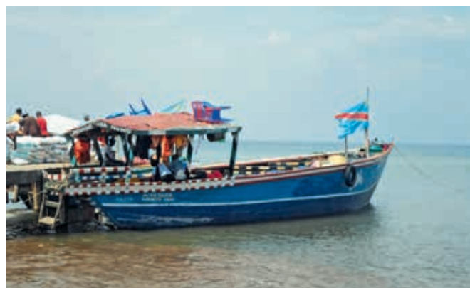
Bateau «déchargé» de retour au port.

une formation scolaire et professionnelle qui leur permettra de s'intégrer dans la société et d'assurer leur subsistance. L'ONG propose également une éducation et des soins médicaux aux enfants et aux jeunes handicapés dans un centre spécialisé. Le programme comprend par ailleurs des formations pour les jeunes. Le CEFI possède des terres agricoles qui sont cultivées à l'aide d'un tracteur acheté par miva afin d'assurer l'autosubsistance du centre. Ces terres sont situées au bord du lac Tanganyika. La navigation est le moyen idéal pour transporter les denrées alimentaires et apporter les éventuels excédents de production sur le marché. C'est pourquoi le CEFI demande