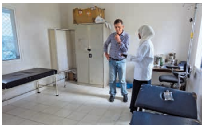
Collaborateur de SSA en conversation avec une infirmière.

La Somalie est considérée comme le pays le plus pauvre et le plus délaissé du monde. Les ressources les plus élémentaires, le savoir-faire et les moyens financiers y font défaut. L'association Hadia Medical Swiss a pour but de renforcer les moyens de subsistance et le système de santé et d'enseignement en Afrique de l'Est, notamment au Somaliland. Les priorités sont l'amélioration de la qualité de l'eau et des infrastructures de santé, ainsi que la construction et la gestion d'écoles primaires. L'organisation partenaire Somaliland Swiss Association (SSA) est responsable de l'exécution des projets sur place. Le gouvernement du Somaliland a demandé à l'association de prendre en charge les hôpitaux de Gebiley et Salaxley. L'approvisionnement en eau et en énergie, la formation du personnel, ainsi que l'équipement et la mise à disposition des médicaments nécessaires comptent parmi les actions initiées par Hadia. Afin d'assurer ces missions, Hadia a impérativement besoin d'un véhicule robuste avec une benne pour SSA. Le soutien de MIVA est essentiel pour permettre à Hadia Medical Swiss de contribuer à la fourniture de services de santé et de faire avancer la construction et l'extension des deux hôpitaux de sorte que les établissements puissent être transférés à des organismes locaux.