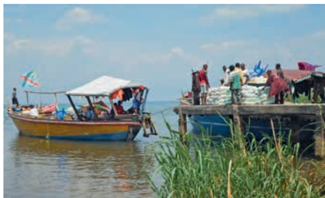
Chargement du bateau en bois pour le transport de marchandises.

Le Centre d'éducation et de formation intégrée (CEFI) aide les enfants défavorisés ou handicapés et les jeunes en leur offrant