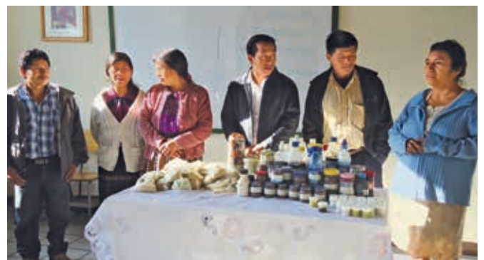
Marchandes et marchands locaux présentant leurs produits sur le marché.

L'Asociación Red Kuchub'al de Comercio Equitativo y Solidario est un réseau d'associations de producteurs ruraux qui propose à ses membres des conseils techniques et des formations en agriculture écologique, en commercialisation et en distribution. Le réseau fabrique des textiles, des médicaments ou encore du chocolat. La production s'effectue souvent dans des lieux difficiles d'accès, ce qui complique la venue des entreprises de transformation, ainsi que la participation aux réunions des membres et aux foires. miva a rendu visite à Kuchub'al en 2014 et a été convaincue par son action. Le renforcement des chaînes de création de valeur locales et l'orientation vers les marchés locaux offrent une alternative aux effets ravageurs de «l'exportation des pauvres» digne d'être encouragée d'un point de vue économique, social et culturel. Pour ce faire, l'équipe a besoin d'un véhicule. Vidéo sur: www.miva.ch/fr/projets .