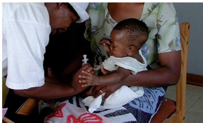
Jeune enfant recevant des soins médicaux.

Dans ce contexte, le Cardinal Rugambwa Hospital d'Ukongu, à 17 kilomètres de Dar es Salaam, rend un service extrêmement précieux. Ce centre de santé créé en 1986 a obtenu le statut