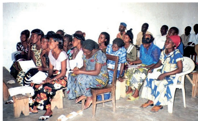
Femmes et hommes assistant à une manifestation de sensibilisation sur le thème du VIH/sida.

Pour accomplir ses diverses missions, SOS AJESS doit être mobile. Elle a impérativement besoin d'un véhicule tout-terrain robuste pour se rendre dans les communautés et atteindre les femmes et les enfants qui nécessitent de l'aide, afin d'améliorer leurs conditions de vie dans cette région en crise.