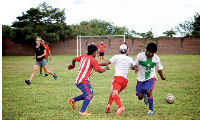
Pendant leur temps libre, les anciens enfants des rues de Casa Oikia jouent au football.

Casa Oikia est un centre doté d'un foyer qui accueille les enfants des rues sans condition. Outre les premiers soins, ils bénéficient d'une éducation scolaire, d'un emploi à la menuiserie, d'activités sportives et de moments de loisir accompagnés. Souvent toxicomanes, ces jeunes reçoivent également un soutien