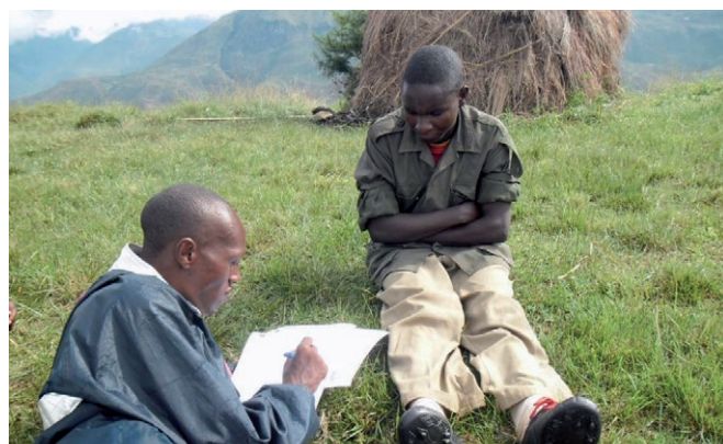
Un collaborateur d'AGAPE en discussion avec un enfant soldat.

Le travail de l'équipe est dangereux: ses membres ont été attaqués plus d'une fois, deux avocats des droits de l'homme ont même été torturés. Pour accomplir sa mission de manière plus sûre et plus efficace, AGAPE a besoin d'un véhicule tout-terrain fiable.