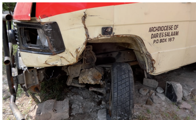
L'ambulance hors d'état de marche depuis deux ans à la suite d'un accident.

L'établissement n'a plus d'ambulance depuis deux ans, son véhicule étant hors d'état de marche à la suite d'un accident. Presque tous les jours, il faut aller chercher des personnes à leur domicile ou les transporter vers un hôpital de référence. Les routes sont en bon état, mais les embouteillages quotidiens qui en-