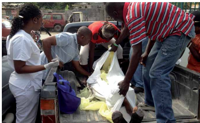
Blessé transporté à l'Hôpital Divine Mercy après un accident de la circulation.

L'Hôpital Divine Mercy de Morne Rouge a ouvert ses portes début 2014. Fin mars, plus de 600 patients étaient déjà enregistrés. L'établissement emploie actuellement 22 personnes, dont 17 femmes. Sa situation sur la Route nationale peut être considérée comme «stratégique». Plusieurs blessés graves, victimes d'accidents de la circulation, ont été amenés à l'hôpital pour recevoir les premiers soins d'urgence. Une nouvelle ambulance aurait permis d'éviter une partie de ces décès! Par ailleurs, sans moyen de transport adapté, il est impossible de fournir des soins de santé absolument nécessaires aux populations pauvres vivant dans les zones reculées et difficiles d'accès. Il est donc urgent d'acquérir une ambulance robuste et polyvalente.