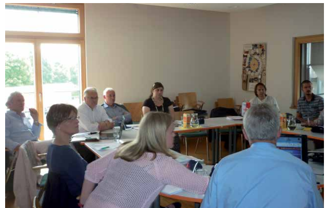
miva meeting: échange des informations.

La directrice de miva Suisse dresse le bilan suivant: bien que les 8 entités miva participantes présentent des tailles et des caractéristiques différentes, elles ont la même volonté farouche de fournir aux personnes défavorisées des pays du Sud des moyens de transport adaptés à leurs besoins, afin d'apporter une aide à l'entraide. Elles ont également en commun l'idée que la mobilité peut se partager. Par ailleurs, il y a beaucoup à apprendre les uns des autres et les synergies devront être encore mieux exploitées à l'avenir. Les entités «orientales» de miva fournissent un important travail avec la Saint-Christophe et les bénédictions de véhicules. Elles soutiennent principalement des projets pastoraux. En revanche, miva Suisse et miva Hollande possèdent des structures et des modes de travail très similaires. Leur contexte leur a permis de se développer en cofinçant aussi des moyens de communication. Même si miva CH et miva NL sont fermement attachées à leurs racines catholiques, elles s'adressent également de manière ciblée à d'autres groupes qui accordent de l'importance à des valeurs telles que la solidarité et l'amour de son prochain. Pour miva Suisse, dont le financement est assuré à 95% par des dons privés, ces autres groupes représentent des donateurs de poids.