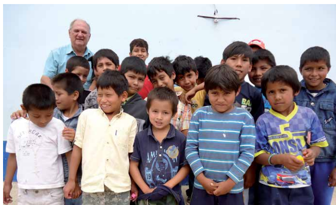
Enfants du foyer Hogar de Niños «Jesús Infante» avec le directeur.

Le foyer d'enfants Hogar de Niños «Jesús Infante» a été créé en 1971 et se trouve sous la responsabilité de l'archevêché de Santa Cruz. En 2000, l'exploitation agricole Granja « Mama Margarita », située en dehors de la ville, a été rattachée au foyer. Le foyer et l'exploitation accueillent tous les garçons et les jeunes hommes de Vallegrande et des environs qui sont orphelins ou