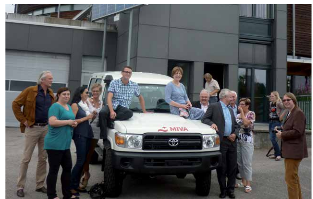
8 membres de miva et l'équipe BBM devant la maison de miva.