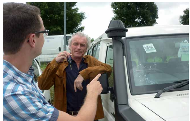
Visite de le nouveau Landcruiser résistant à l'eau.