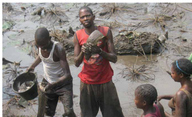
Agriculteurs et agricultrices en train de cultiver des denrées alimentaires.

Pour faire face à cette désolation, le diocèse de Tshumbe a mis sur pied des programmes qui favorisent l'agriculture et renforcent la solidarité entre les personnes nécessiteuses. La diversification et l'augmentation de la production alimentaire, l'optimisation des semences et le développement des techniques agricoles devraient permettre aux populations pauvres de mieux nourrir. La vente de leur production améliore les revenus des groupes de villageois participants. Les groupes de femmes et d'agriculteurs autogérés, mais aussi la prévention de la violence sexuelle et l'accompagnement psychosocial des victimes de violences renforcent les communautés. Pour gérer les activités dans les villages reculés, les responsables de projets doivent être mobiles. C'est pourquoi le diocèse demande de l'aide pour acquérir un véhicule tout-terrain.