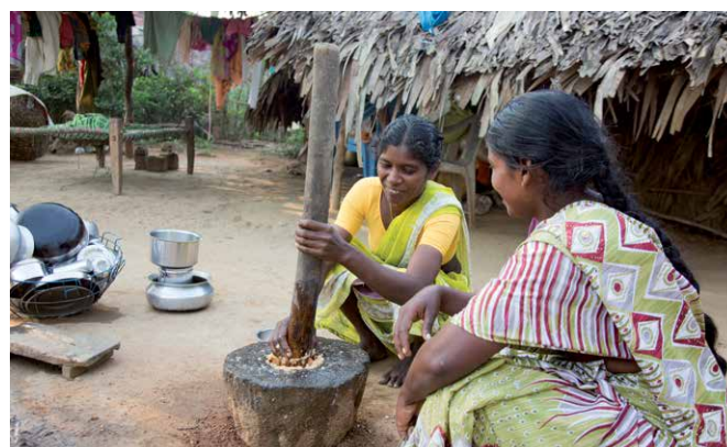
Femmes dalits et adivasis en train de cuisiner.

Dans l'Andhra Pradesh, un quart de la population appartient aux peuples sans caste des Dalits ou des Adivasis (autochtones). Les femmes sont doublement frappées par la pauvreté. Ce sont des êtres humains de seconde classe: bébés indésirables, mariées enfants, main d'œuvre exploitée, femmes battues et veuves rejetées par la société. Ainsi, la malnutrition, les maladies et l'analphabétisme font souvent partie de leur quotidien. Même si la loi les protège, les mesures prises sont peu respectées et leurs droits ne sont pas appliqués. Grâce à un engagement de longue date, l'ONG Andhra Pradesh Social Service Society (APSSS) est parvenue à organiser 250 000 femmes dalits et adivasis en fédérations qui œuvrent pour que les femmes puissent générer un revenu minimum régulier. Outre l'accès aux moyens de subsistance, APSSS lutte contre la violence à l'égard des femmes, la discrimination des veuves, les pratiques de dot et l'abandon des filles. L'ONG a récemment reçu un prix du gouvernement pour son travail. Pour pouvoir offrir un accompagnement professionnel à ces groupes de femmes, l'équipe d'APSSS doit être mobile. Son vieux véhicule arrivant en fin de vie, l'ONG demande de l'aider à acquérir un nouveau véhicule tout-terrain robuste.